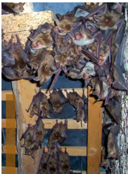
Colonie de Grands Murins dans un comble