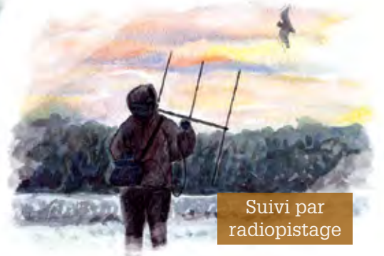
Suivi par radiopistage

La découverte d'une colonie de mise bas ou d'hivernage est un premier pas mais ne constitue pas une fin en soi. Selon les espèces et l'importance des effectifs, un suivi régulier est souvent nécessaire afin d'être en mesure d'évaluer l'évolution du nombre d'individus dans la colonie. Ces suivis permettent ainsi de guider les actions de préservation à mettre en œuvre et de mesurer leurs effets : ce sont des « sonnettes d'alarme » en cas de problème. D'autre part, ces dénombrements locaux s'inscrivent dans des suivis globalisés à l'échelle départementale, régionale, nationale voire européenne.