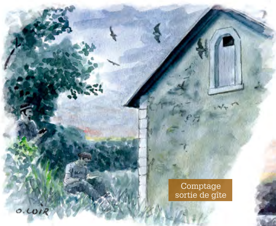
Comptage sortie de gîte

En parallèle, certaines de ces colonies sont suivies annuellement afin d'appréhender au mieux l'évolution des populations de chauves-souris : « Mieux connaître pour mieux protéger ».