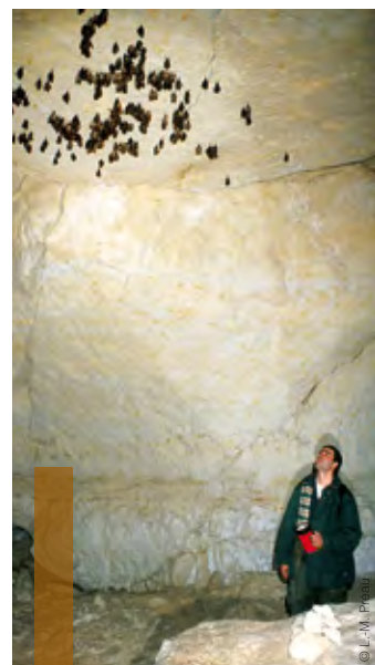
Comptage d'un essaim de Grands Rhinolophes

Lorsque la méthode pour suivre un site est définie, le propriétaire du gîte abritant la colonie doit s'attendre à au moins une visite régulière (chaque année, ou à intervalle régulier). Le chiroptérologue, généralement bénévole, passera une fois par an s'il s'agit d'un site d'hivernage et une ou deux fois pour les sites de mise bas. L'accès au gîte devra être facilité et le chiroptérologue vous préviendra de sa visite, en prenant bien évidemment en compte vos volontés. Il est parfois possible de l'accompagner pour participer au comptage.