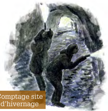
Comptage site d'hivernage