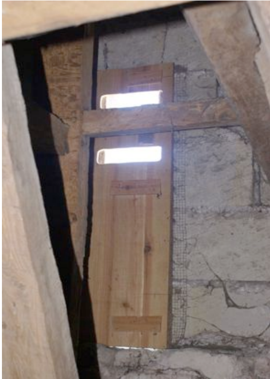
Chiroptière remplaçant des grillages