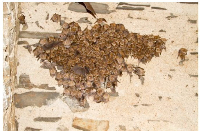
Colonie de mise-bas de Murin à oreilles échancrées et de Grand Rhinolophe