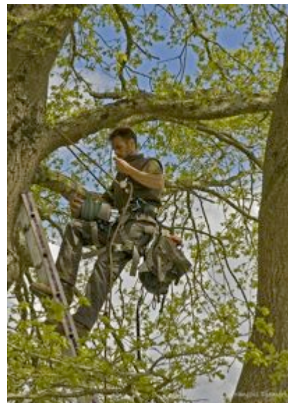
Pose de gîtes dans des arbres de part et d'autres du Pont Béranger