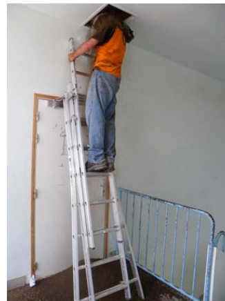
Accès à une nurserie de Grand Murin à Sillé-le-Guillaume (72)

Un radio-track en forêt domaniale de Bercé a également été organisé par le CPIE Vallées de la Sarthe et du Loir et l'ONF. Dans cette forêt d'environ 5000 hectares constituée à 2/3 de feuillus, tout était à découvrir sur l'utilisation par les Chiroptères de l'espace forestier. Six individus ont été équipés dont 3 Barbastelles, 1 Oreillard roux, 1 Murin de Bechstein et 1 Noctule de Leisler. Résultat : une vingtaine d'arbres-gîtes ont ainsi été recensés et de nombreux terrains de chasse identifiés !