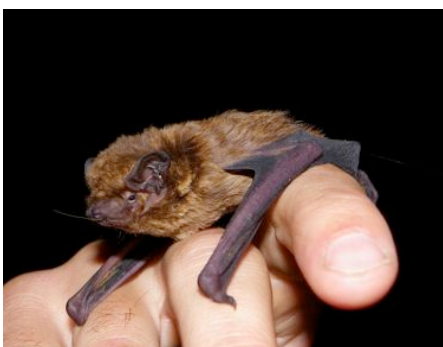
Noctule de Leisler capturée et équipée en forêt de Bercé (72)

- Des prospections de recherche de colonies de parturition ont également été entreprises sur 2 Communautés de communes du Sud-Sarthe. Recherches également fructueuses par la découverte entre autres de deux colonies mixtes Grand Rhinolophe/Murin à oreilles échanquées dont l'une des nurseries atteint 500 femelles