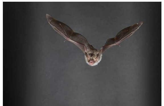
Murin de Bechstein