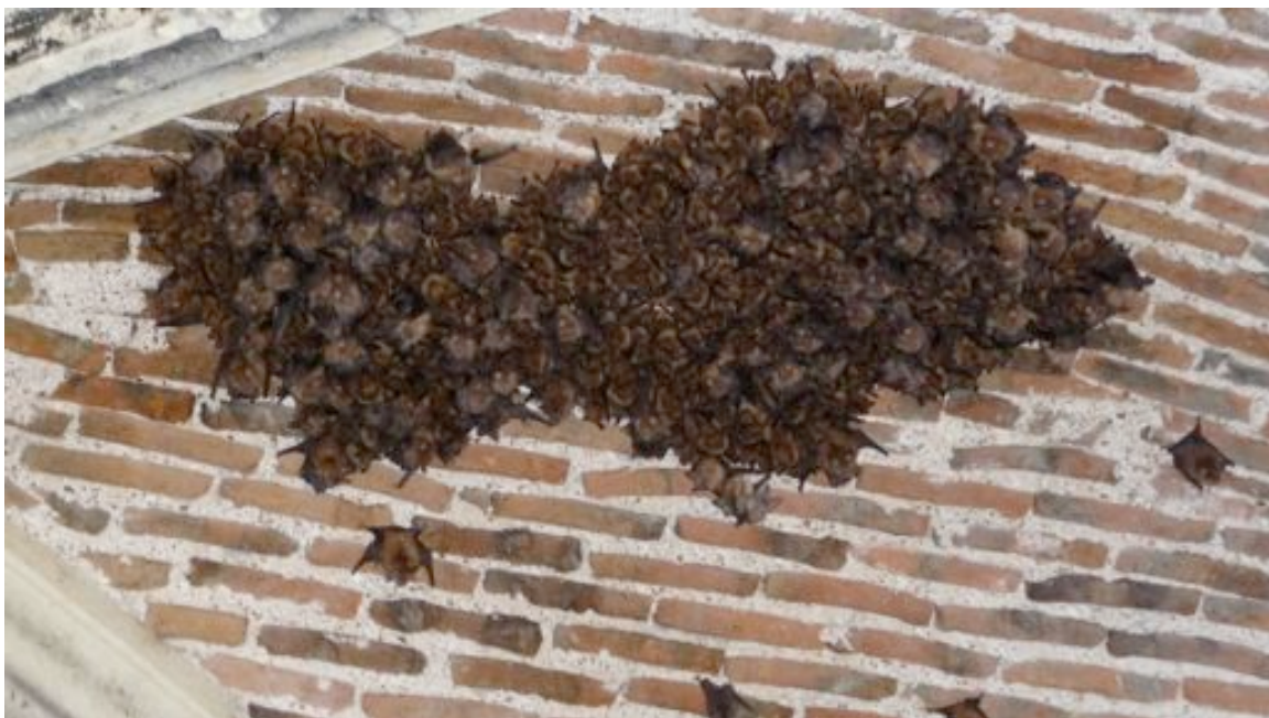
Colonie mixte de Grands Rhinolophes / Murins à oreilles échancrées de Bouzillé

On citera particulièrement la découverte de la plus importante colonie de Grands Murins de Loire-Atlantique à Ancenis et celle d'une colonie mixte de Grands Rhinolophes et Murins à oreilles échancrées d'importance régionale à Bouzillé (49). Deux colonies de Petits Rhinolophes situées dans des contextes paysagés très défavorables ont fait l'objet d'une étude de territoires de chasse afin de mettre en place des mesures de protection de ces derniers.