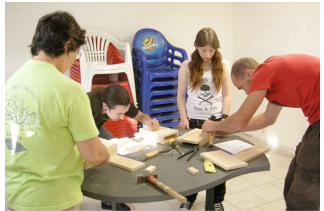
Fabrication de gîte à chauve-souris à Saulges par MNE

Nous espérons en 2012, parcourir les communes manquantes afin d'avoir un état des lieux des colonies de mise bas des chauves-souris en Mayenne .