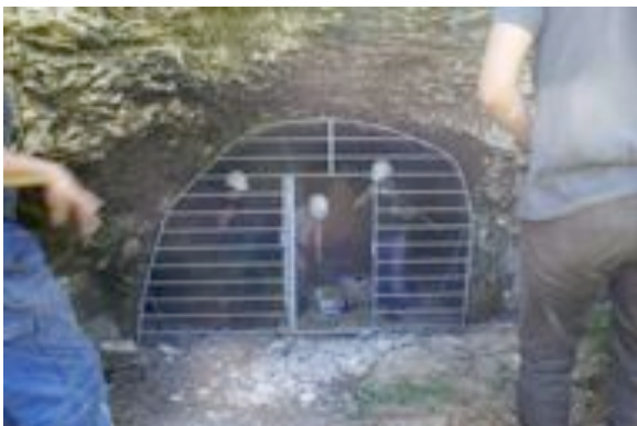
Pose d'une grille anti-intrusion sur mesure

Comme chaque hiver, nombre de bénévoles reprendront de décembre à février les chemins sombres et inquiétants des innombrables souterrains angevins si riches de leurs populations de chauves-souris. Une nécessaire coordination de ces comptages est assurée à nouveau cet hiver par la LPO Anjou. Cela permet à la fois de limiter le dérangement sur les sites en ne passant qu'une seule fois, de protéger les rapports parfois fragiles avec les propriétaires et d'assurer le minimum d'encadrement indispensable au regard des risques liés à la fréquentation du milieu souterrain (désorientation, effondrements...). Envie de participer ? contactez nous.