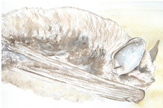
Murin d'Alcathoe