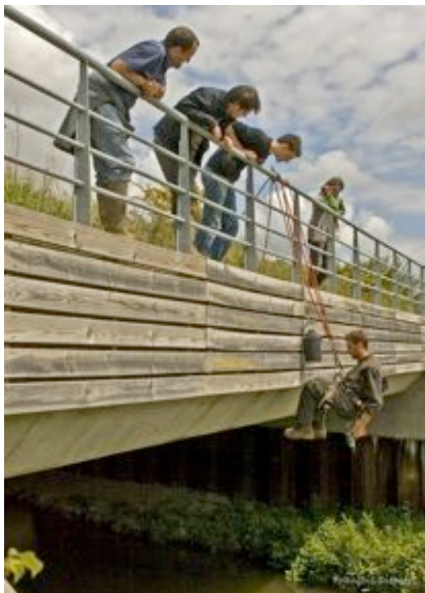
Pose de gîtes au Pont Béranger