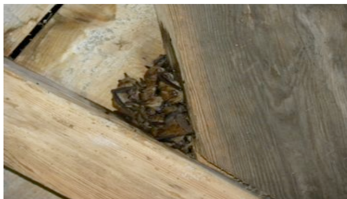
Murins à oreilles échancrées du château d'Orvault