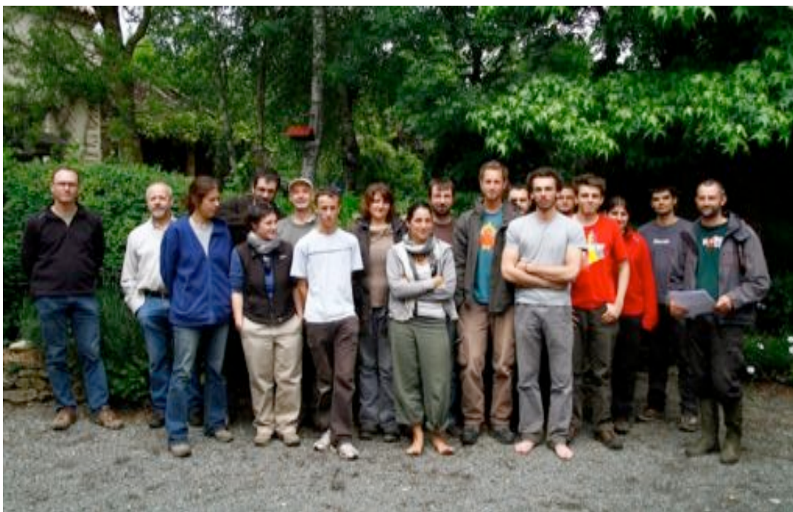
Groupe de bénévoles qui ont participé au week-end de prospection 2011