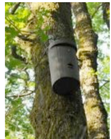
Pose de gîte par Mauges Nature en forêt de Nuillé