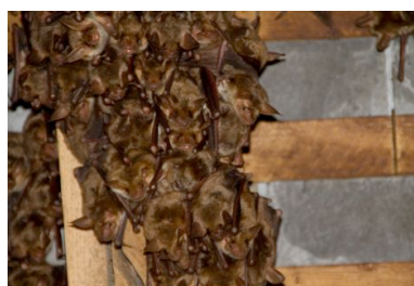
Colonie de Grands Murins

La participation aux chantiers, ainsi que l'implication dans la signature de conventions ou la mise en place d'APPB sont ouvertes à tous les bénévoles désirant s'investir dans la thématique de conservation des chauves-souris.