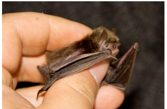
Murin d'Alcathoe

L'une de ces sessions a vu 3 femelles allaitantes suivies sur le territoire boisé, propriété du Conseil Général de Maine-et-Loire, de l'Isle Briand au Lion d'Angers fin juin. Ce radiopistage a permis d'identifier une dizaine d'arbres gîtes, de trouver les premières colonies angevines de mise bas de Murin d'Alcathoe et de Murin de Bechstein, ainsi que d'observer les types d'habitats forestiers utilisés. L'ensemble des arbres découverts seront maintenus et complétés par la création d'îlots de sénescence dans les secteurs les plus densément utilisés comme territoires de chasse sur ce site exceptionnel du fait de sa diversité et la densité du peuplement chiroptérologique.